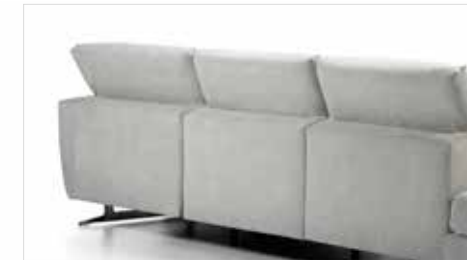
BARBADOS | FL300 | MONA ANGORA