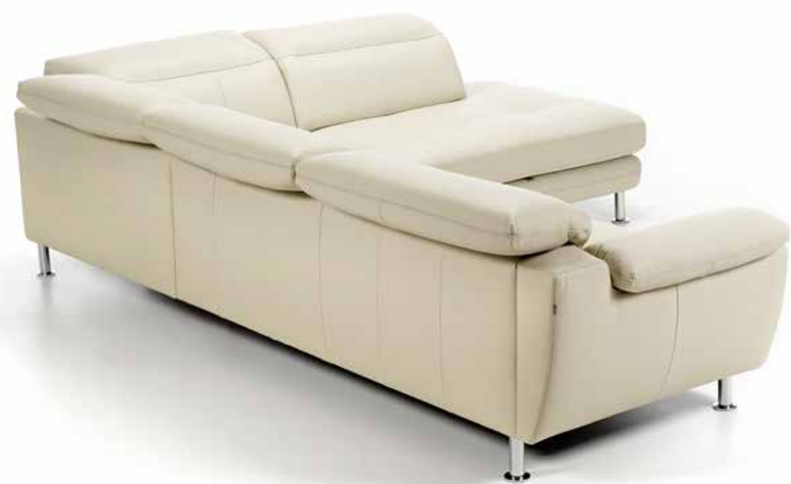
BARBADOS | BG280 | MONTANA SILVER

EINE INSEL DES WOHLGEFÜHLS - MEIN TRAUM WIRD WAHR.