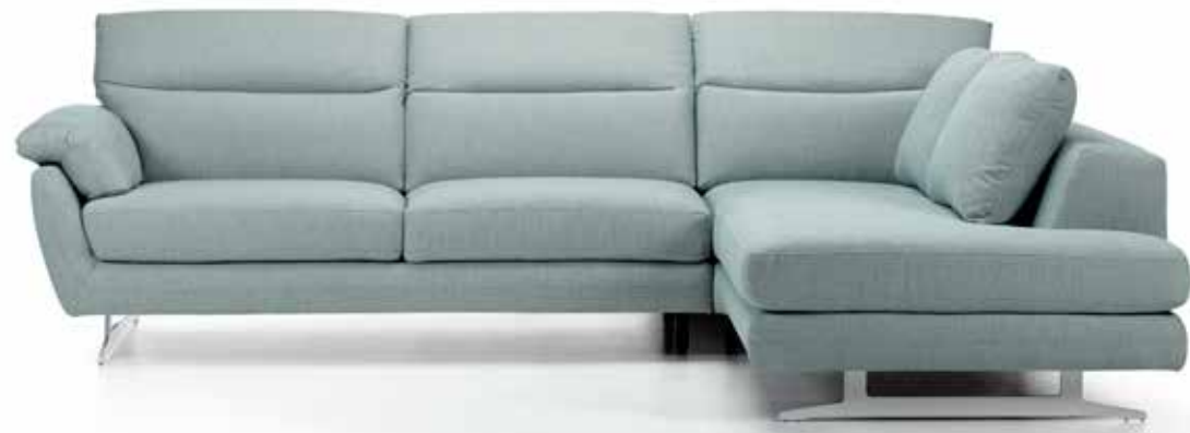
BARBADOS | BS280 | EVITA ICE

AN OASE OF WELL-BEING - MY DREAM CAME TRUE.